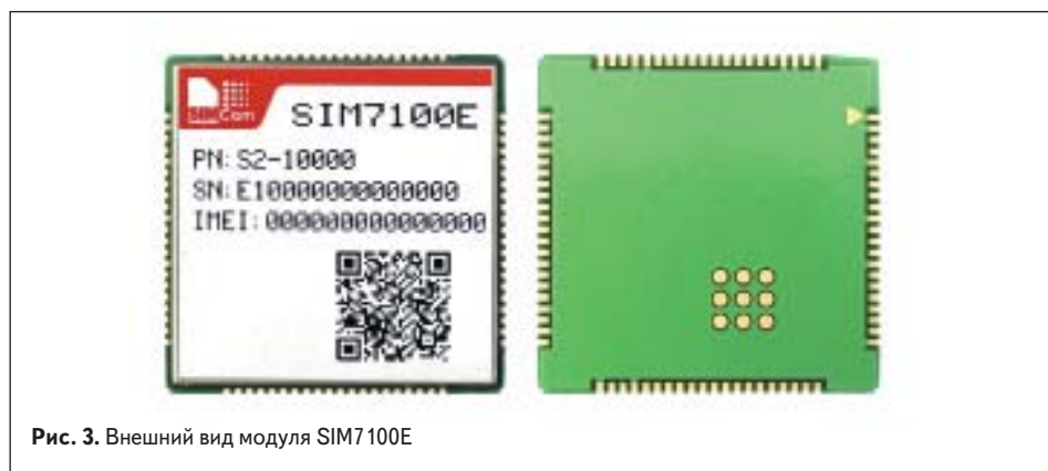
Рис. 3. Внешний вид модуля SIM7100E

Модуль SIM7100 аппаратно совместим с модулем SIM5360E, предназначенным для работы в сетях 3G. Однако при замене одного модуля на другой