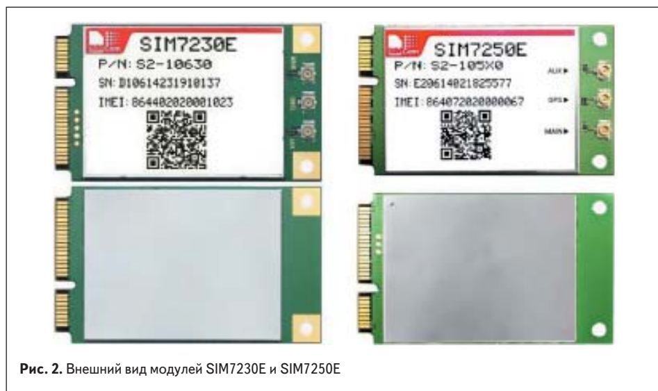
Рис. 2. Внешний вид модулей SIM7230E и SIM7250E

антенну на диапазоны (GSM/WCDMA/LTE) и применять ее и как Main, и как Diversity.